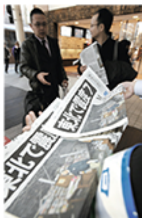
東日本で発生した大地震を伝える熊日号外を受け取る人たち 2011年3月11日夕、熊本市上通