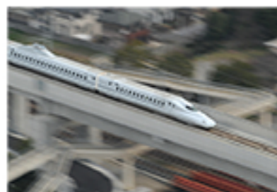
九州新幹線が全線開通した 2011年3月12日