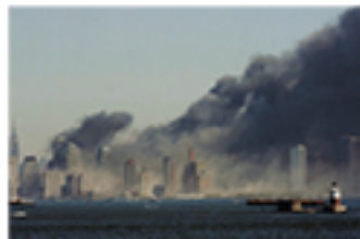
世界貿易センタービルが炎上し、黒煙に覆われるニューヨーク市街 2001年3月11日午前(AFP共同)