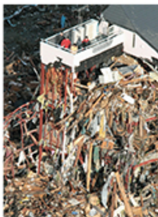
津波の被害を受けた住宅に取り残され救助を求める人たち 2011年3月12日午前8時 岩手県陸前高田市