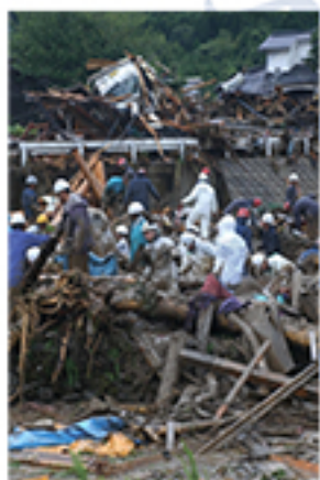
水俣市は集中豪雨で大規模な土石流が発生、19人が死亡した 2003年7月21日 水俣市宝川内集地区

1年2カ月後には、平成となり、バブル経済は、じきに失速長くて深い、冬の時代に入ります。