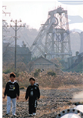
1997年に三池炭鉱が閉山して2年、後ろに見える万田坑は国重文として保存されることになった 1999年1月

世安にある新聞博物館が開設したのは、1987(昭和62)年10月。ことし30年です。