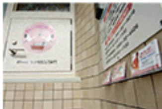
熊本市・慈恵病院で始まった「このとりのゆりかご」 2007年5月10日