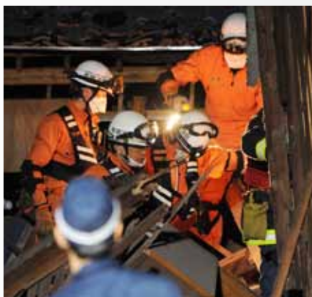
前震後、救助活動する消防隊(益城町)