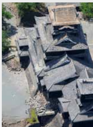
屋根瓦が吹っ飛んだ熊本城天守閣